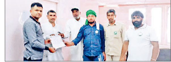
जींद। मार्केट कमेटी कार्यालय में ज्ञापन सौंपते भाकियू नेता।

मैं सौंपे ज्ञापन में बताया कि सरसों का खरीद कार्य शुरू नहीं हुआ है, जिससे जल्द शुरू करवाया जाए। एक अप्रैल से गेहूं खरीद कार्य शुरू हो रहा है। इससे पहले ही मंडी में शौचालयों की सफाई करवाई जाए। मंडी परिसर की अच्छे से सफाई करवाई जाए। पीने के पानी को लेकर वाटर कूलर को ठीक करवाया जाए। मंडी में कई जगह सड़कों में गड्डे हैं, उन्हें ठीक करवाया जाए। बारिश के समय तिरपाल की व्यवस्था करवाई जाए। इसके साथ ही लाइट का प्रबंध किया जाए। भाकियू नेताओं ने कहा कि अगर फसल खरीद के दौरान किसानों को कोई परेशानी आई तो भाकियू आंदोलन से पीछे नहीं हटेंगे।