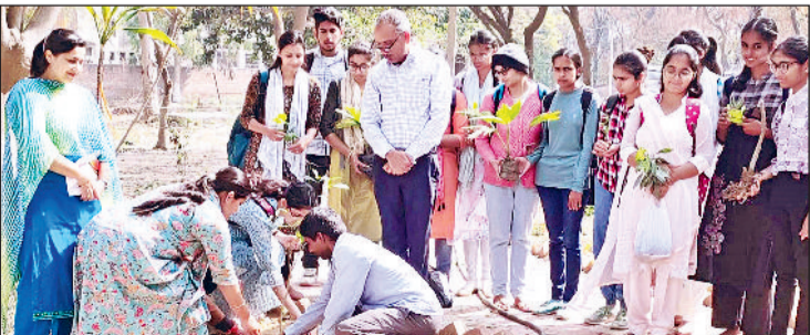
जौद। महाविद्यालय परिसर में पौधे रोपित करते हुए।