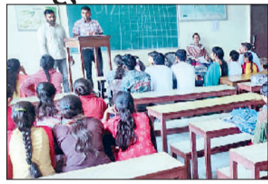
जौद। प्रतियोगिताओं में भाग लेते हुए प्रतिभागी।