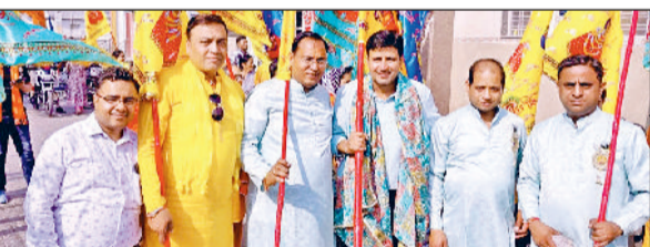
जौद। निशान यात्रा के दौरान ध्वजा उठाए श्रद्धालु।