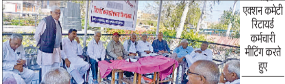
हरिभूमि न्यूज़ ▶▶ गुहला-चीका

भाजपा सरकार ने 10 वर्षों में पेंशनरों की एक भी मांग पर बातचीत करने के लिए पेंशनरों की यूनियन को नहीं बुलाया इसलिए आने वाले लोकसभा चुनाव में ज्वाइंट एक्शन कमेटी रिटायर्ड कर्मचारी हरियाणा वर्तमान सरकार के सभी प्रत्याशियों का डटक विरोध करेगी व इंडिया गटबंधनके प्रत्याशियों को जिताने में सहयोग