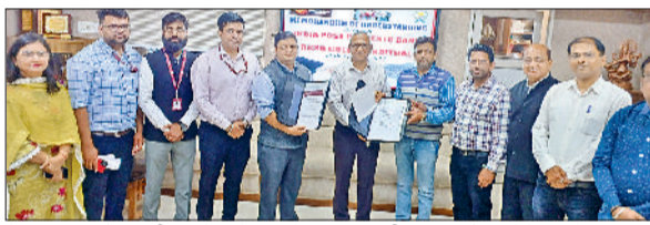
कैथल। आरकेएसडी कॉलेज कैथल के पदाधिकारी इंडिया पोस्ट पेमेंट्स बैंक के साथ समझौता करते हुए।

आईपीपीबी के साथ एक समझौता ज्ञान पर हस्ताक्षर करने पर सहमति व्यक्त की है, जो कि संचार मंत्रालय के तहत डाक विभाग के माध्यम से भारत सरकार के पूर्ण स्वामित्व वाली एक सार्वजनिक लिमिटेड कंपनी है, जो आरकेएसडी कॉलेज, कैथल के परिसर और बाहर के विद्यार्थियों के लिए विभिन्न इंटरनेट/ऑडिओ/वीडियो/व्यावसायिक प्रशिक्षण/संकाय विकास कार्यक्रमों