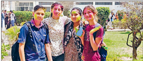
जौद। होली खेलते हुए छात्राएं।