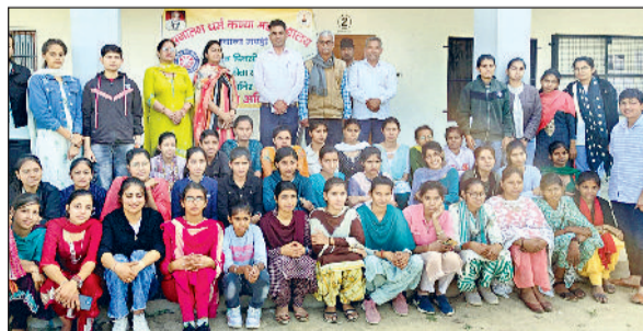
जौद। शिविर में भाग लेते हुए स्वयंसेवक।