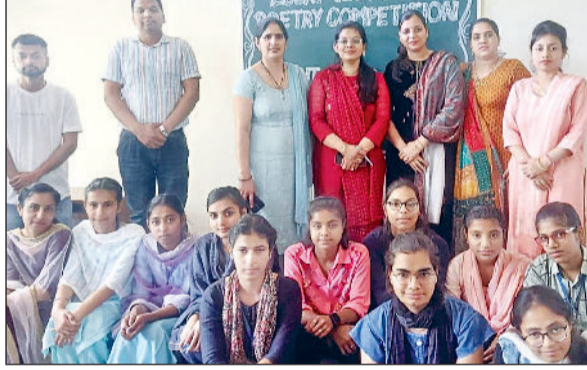
जौद। प्रतिभागी छात्राओं को सम्मानित करते हुए।

मिल पाएगा। होली खेलते समय यदि रंग या गुलाल आंखों या मुंह में जाता है तो तुरंत सबसे पहले साफ पानी से सफाई करें।